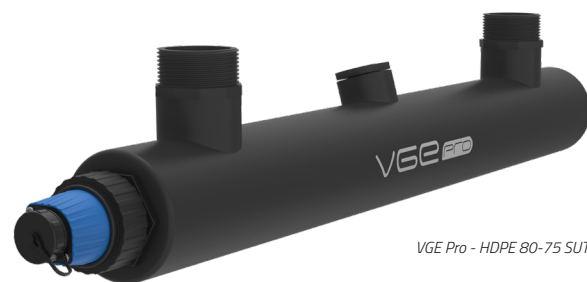
VGE Pro - HDPE 80-75 SUT

Utilizando plásticos técnicos de alta calidad en todo el cuerpo del sistema, VGE creó una solución resistente a la corrosión que garantiza una larga vida útil, incluso en entornos con agua salada y altas temperaturas.